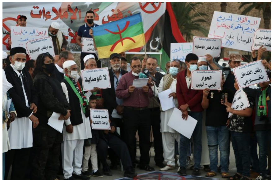
Un gruppo di libici si riunisce per organizzare una protesta contro le riunioni del dialogo politico

introdurre criteri di "governance" compatibili con gli standard delle imprese occidentali in attesa di spartirsi gli affari di una prossima ricostruzione. Al contrario, gli attivisti e i giornalisti libici, quelli che non hanno riparato all'estero dopo il 2011, sono sistematicamente fatti oggetto di minacce, aggressioni, rapimenti e omicidi mirati da parte delle milizie dell'Ovest come dell'Est, come documentano, tra gli altri, Human Right Watch 19 , il Libyan Center for Freedom of the Press 20 e Reporters sans frontières 21 .