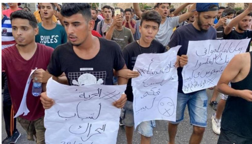
Tripoli, agosto 2020

Le manifestazioni popolari promosse dai giovani nel giugno 2020 a Bengasi e nell'agosto a Tripoli, Sabrata e Mazda 32 , mobilitazioni che sono sembrate anche più partecipate di quelle contro il deterioramento delle condizioni di vita, sono state represses con le armi dalle milizie fedeli a Sarraj e/o a Bashaga. Le proteste contro le interruzioni di corrente e la carenza di acqua, l'alto costo della vita, la corruzione sono proseguite nei mesi successivi in diverse città dell'Ovest e dell'Est pur, per quello che si può dedurre dalle scarsissime informazioni disponibili in lingue non arabe, senza alcun organo direttivo.